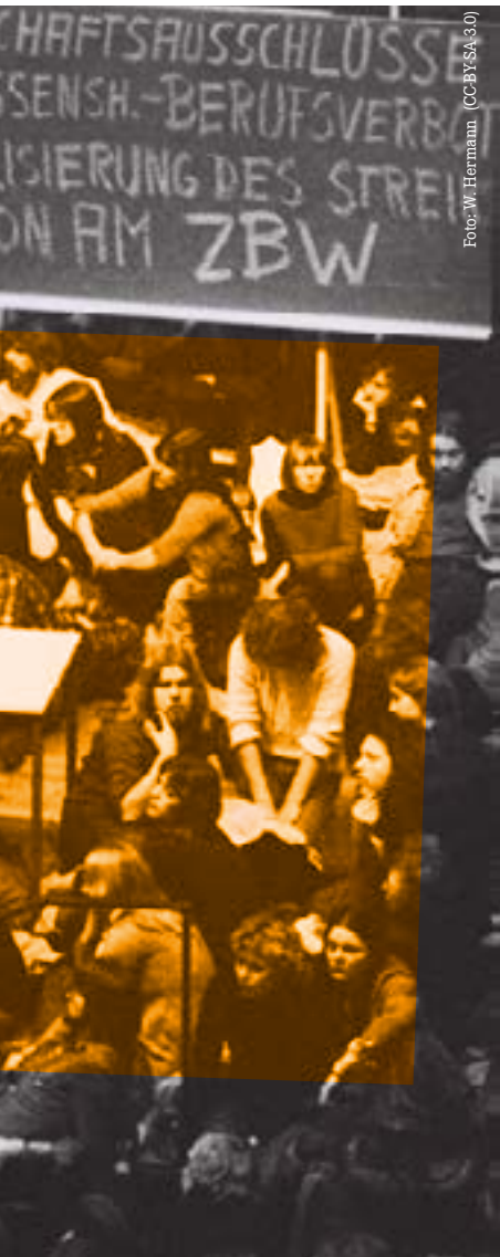
Volksversammlung im Audimax der Technischen Universität Berlin (TU)

Der Ursprung des Begriffs und der Praxis findet sich in Horkheimers Aufsatz „Traditionelle und kritische Theorie“, der gleichzeitig die Frankfurter Schule begründete. Kritische Wissenschaft